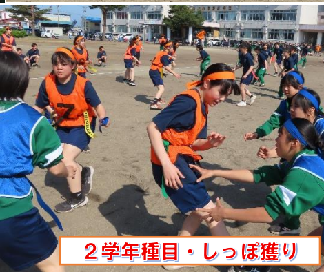
2学年種目・しっぽ獲り