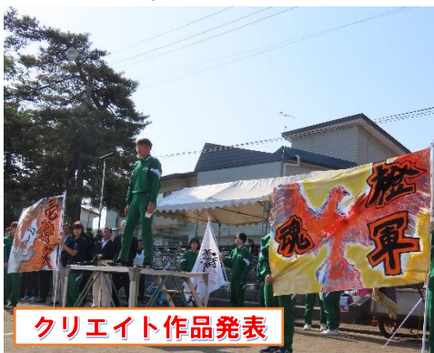
クリエイト作品発表

当日は晴天に恵まれ、生徒たちは主体的に活動し、生き生きと活躍する姿を見せてくれました。