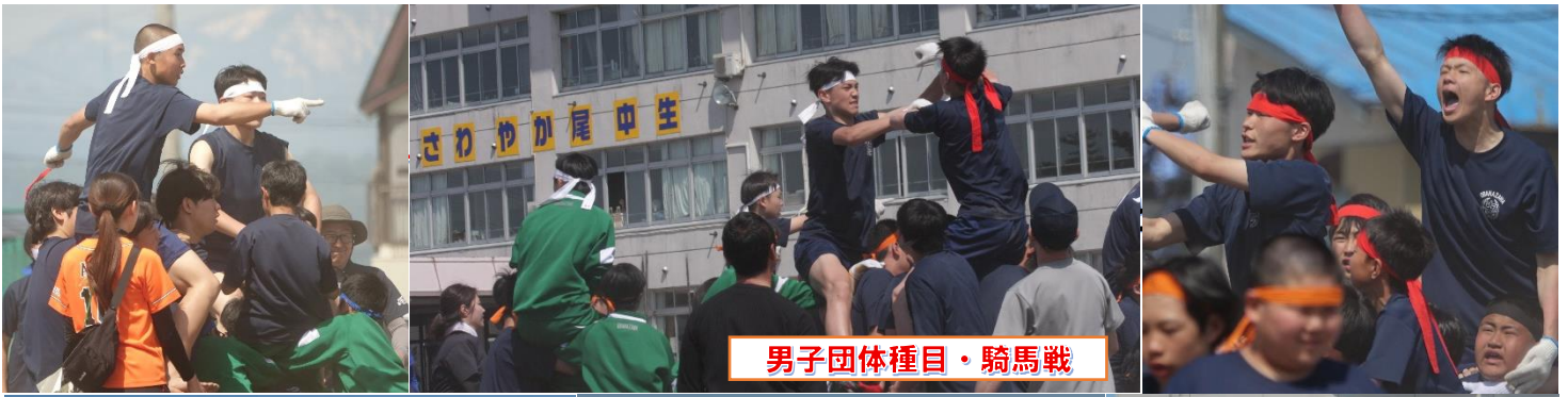
男子団体種目・騎馬戦