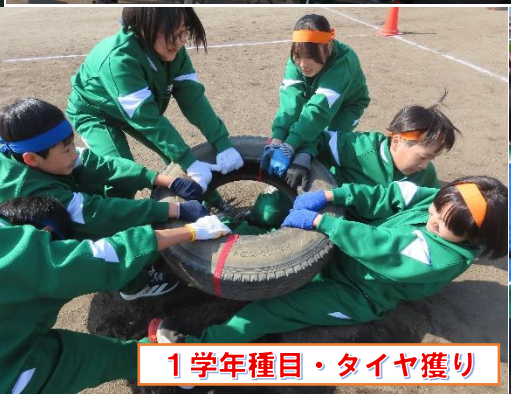
1学年種目・タイヤ獲り