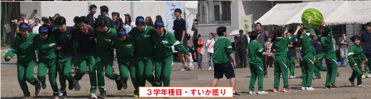
3学年種目・すいか獲り