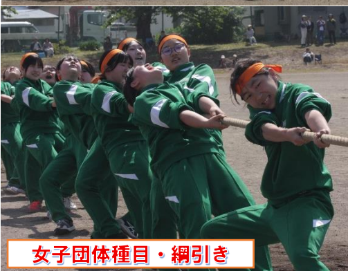
女子団体種目・綱引き