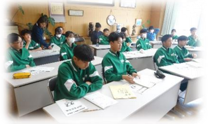
練習場所を決める話し合いです