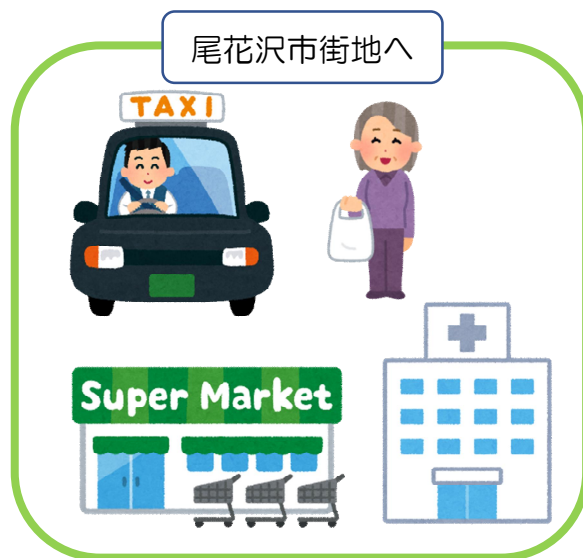
尾花沢地区 利用可能範囲