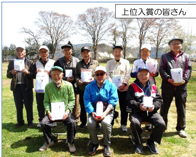
上位入賞の皆さん