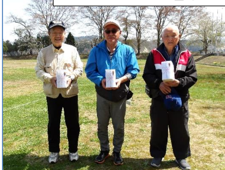
ホールインワンの皆さん