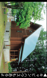
▲キャンプ場の中にある木造小屋