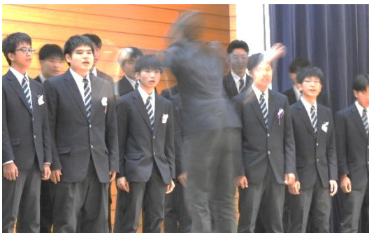
↑合唱 最優秀賞 3-1「手紙」

11月1日(土)に尾花沢中を会場に文化祭を開催しました。体育館では全クラスによる合唱コンクールのほか、吹奏楽部の演奏や芸術部PCチームの視聴覚教材上映、実行委員会企画のクラスTシャツづくり、3年生の総合的な学習の壁新聞の掲示などが行われました。また、1階多目的ホールでは、芸術部美術チームの作品展示や英語・家庭科などの授業で作った学習成果物の掲示が行われました。今年度の文化祭テーマにふさわしく、お互いに認め合う生徒一人ひとりのメッセージが体育館の壁に貼られ、メイン会場を彩るなど、みんなが自分らしく輝いた1日になりました。特に合唱コンクールでは、練習の成果を充分に発揮して素敵な時間をみんなで共有できました。会場にお越しいただいたみなさんから、生徒を応援していただき大変ありがとうございました。