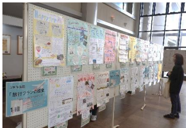
↑授業や芸術部の作品展示