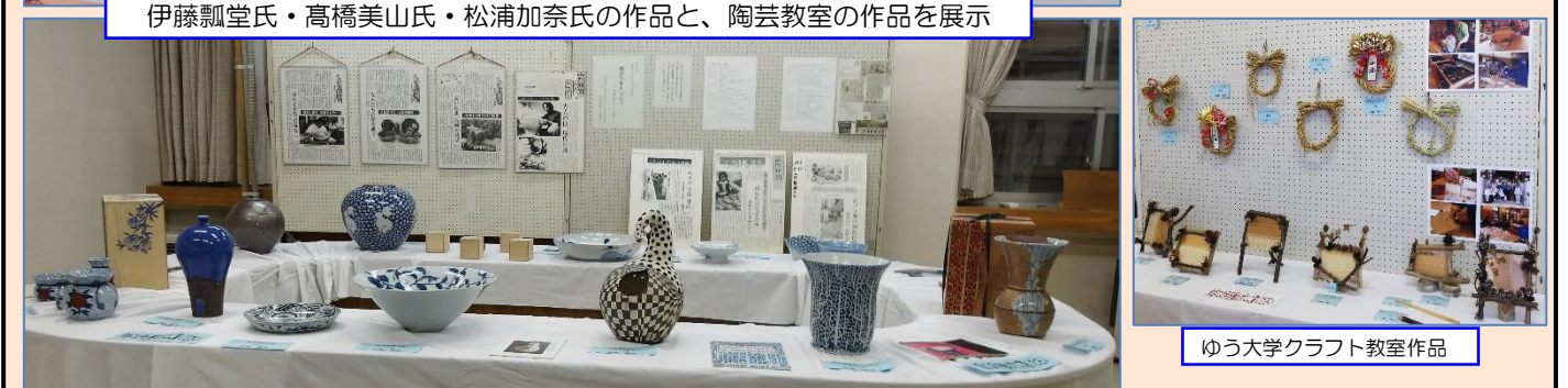
ゆう大学クラフト教室作品