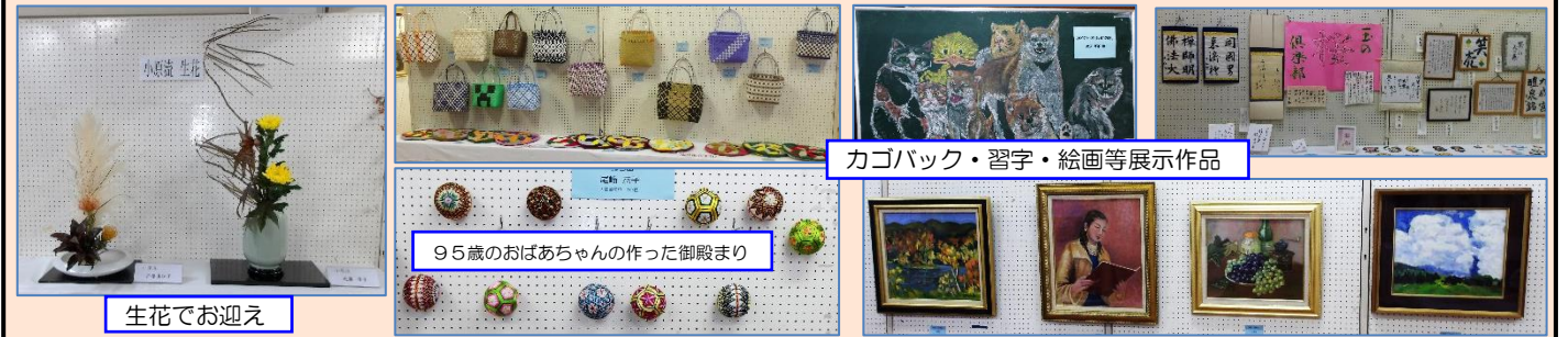
カゴバック・習字・絵画等展示作品