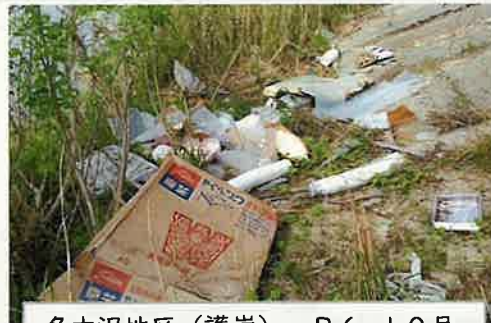
名木沢地区(護岸) R6.10月 家庭ゴミ(粗大ゴミ)投棄