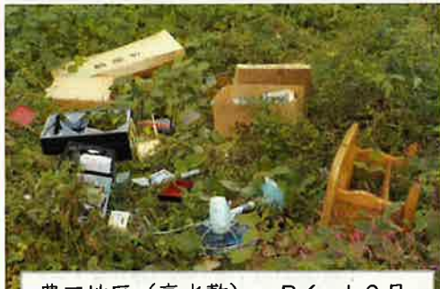
豊田地区(高水敷) R6.10月 家庭ゴミ(粗大ゴミ)投棄

大石田出張所では河川パトロールを行い、不法投棄の箇所や投棄物などを厳しくチェックしていますが、通行者が少なく人目につきにくい場所に悪質な不法投棄が多く見られます。