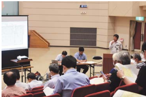
▲6月18日、近隣住民に向けて行われた工事説明会