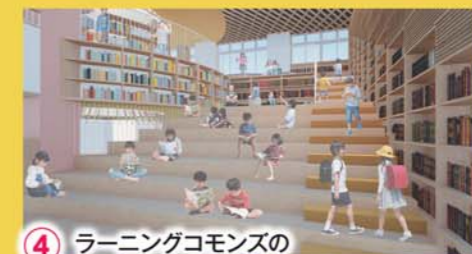
4 ラーニングcommonsの2階と3階をつなぐ大階段