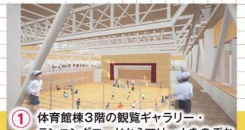
1 体育館棟3階の観覧ギャラリー・ランニングロードからアリーナをのぞむ