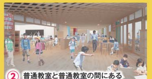
2 普通教室と特別教室の間にある多目的スペース