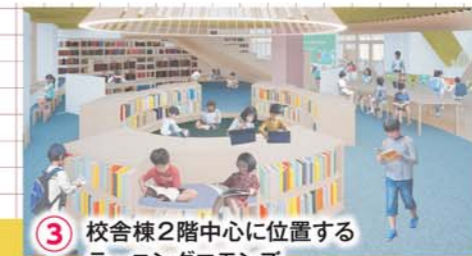
3 校舎棟2階中心に位置するラーニングcommons