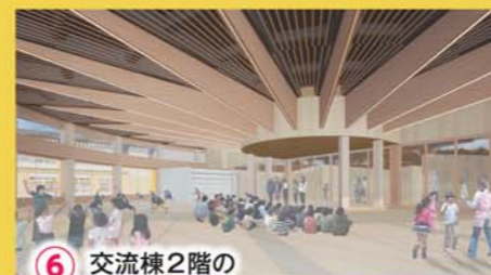
6 交流棟2階のランチルーム兼多目的ホール