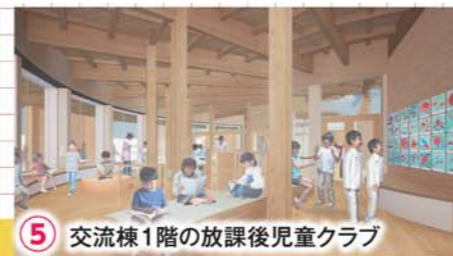
5 交流棟1階の放課後児童クラブ

目指す新しい学校の内部を仮想体験できる!? ※3月中旬頃動画アップ予定 お楽しみに!