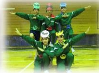
芸術部 ムービー発表