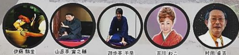
主催：維豊気会 協賛：薬師寺 上ノ畑焼陶芸センター 银山温泉有志一同