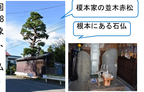
榎本家の並木赤松

尾花沢市では、羽州街道に関わる貴重な遺構として赤松と2基の石仏がセットで令和4年1月27日有形文化財の史跡として指定されました。「市教育委員会」より