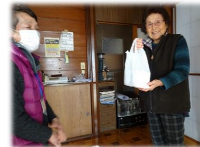
初めてケーキいただきました♡

福原地区の高齢者一人世帯へ、ケーキの配達が行われました。例年は食生活改善推進協議会のみなさんによる手作り弁当を配達していましたが、コロナ禍の中、安心・安全を最優先に考えて弁当配達は今も中止となりましたが、高齢者のみなさんに少しでも喜んでもらおうと、代わりにケーキを準備し、民生委員の方々に配達していただきました。ケーキには福原中学校の生徒たちによる心のこもったメッセージカードも添えられ、受けとった方は「毎年ありがたいちゃ〜学校生徒のメッセージも楽しみにしてたっけ」と大変喜んでいらっしゃいました。ご協力いただいた民生委員のみなさん、福原中学校のみなさん、ありがとうございました。