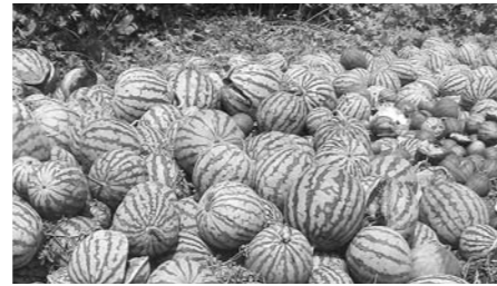
▲山に放置されたスイカ

野生鳥獣への餌付けをしていることとなり、人慣れと鳥獣の増加にも繋がってしまいます。