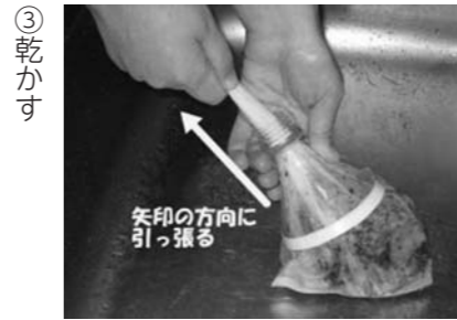
▲ペットボトルの上部を使った水切り方法

水道メーター検針員募集 市内に在住し、70歳以下の健康で働く意欲のある方を募集しています。検針期間は毎月15日から約10日間(12月から3月は休み)になります。なお、検針していただく地区は尾花沢地区(二藤袋除く)と福原地区です。検針員希望の方は7月1日から10月15日まで随時受付します。電話連絡の上左記まで履歴書を持参してください。(土日祝日を除く)