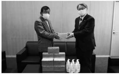
児童福祉施設へ不織布マスク1,000枚、500mlの消毒液24本を寄贈されました。