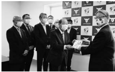
「市民に少しでも貢献できれば」と会員18社の皆さんで200万円の寄附金を寄贈されました。