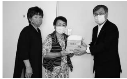
未来ある子どもたちに少しでも役立てればと市内全小中学校へ不織布マスク4,220枚寄贈。