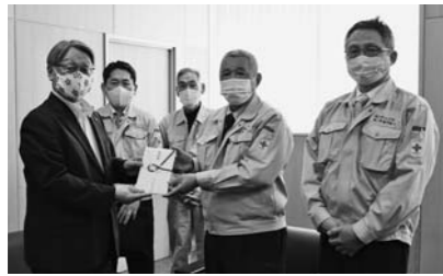
組合加入の13社の皆さんより寄附金30万円を寄贈されました。