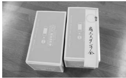
市内小中学校と市教育委員会へ不織布マスク800枚を寄贈されました。