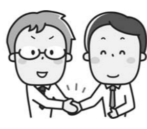
新型コロナウイルス感染症対策に役立ててほしいと寄附金200万円を寄贈されました。