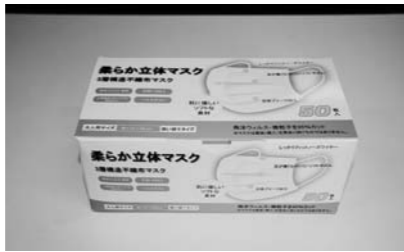
新型コロナウイルス対策に役立ててほしいと不織布マスク6,000枚を寄贈されました。