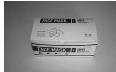
新型コロナウイルス対策に役立ててほしいと医療用マスク1,000枚を寄贈されました。