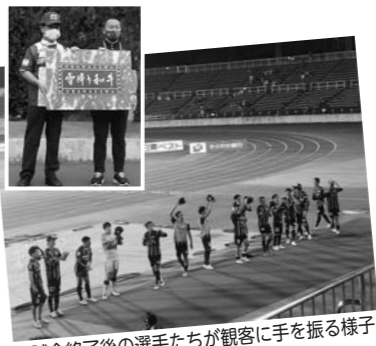
▲試合終了後の選手たちが観客に手を振る様子