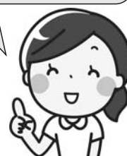
母子健康コーディネーター

お子様の健やかな成長のため、として保護者の不安や悩みに寄り添った支援を行っています。いつでもご相談ください。