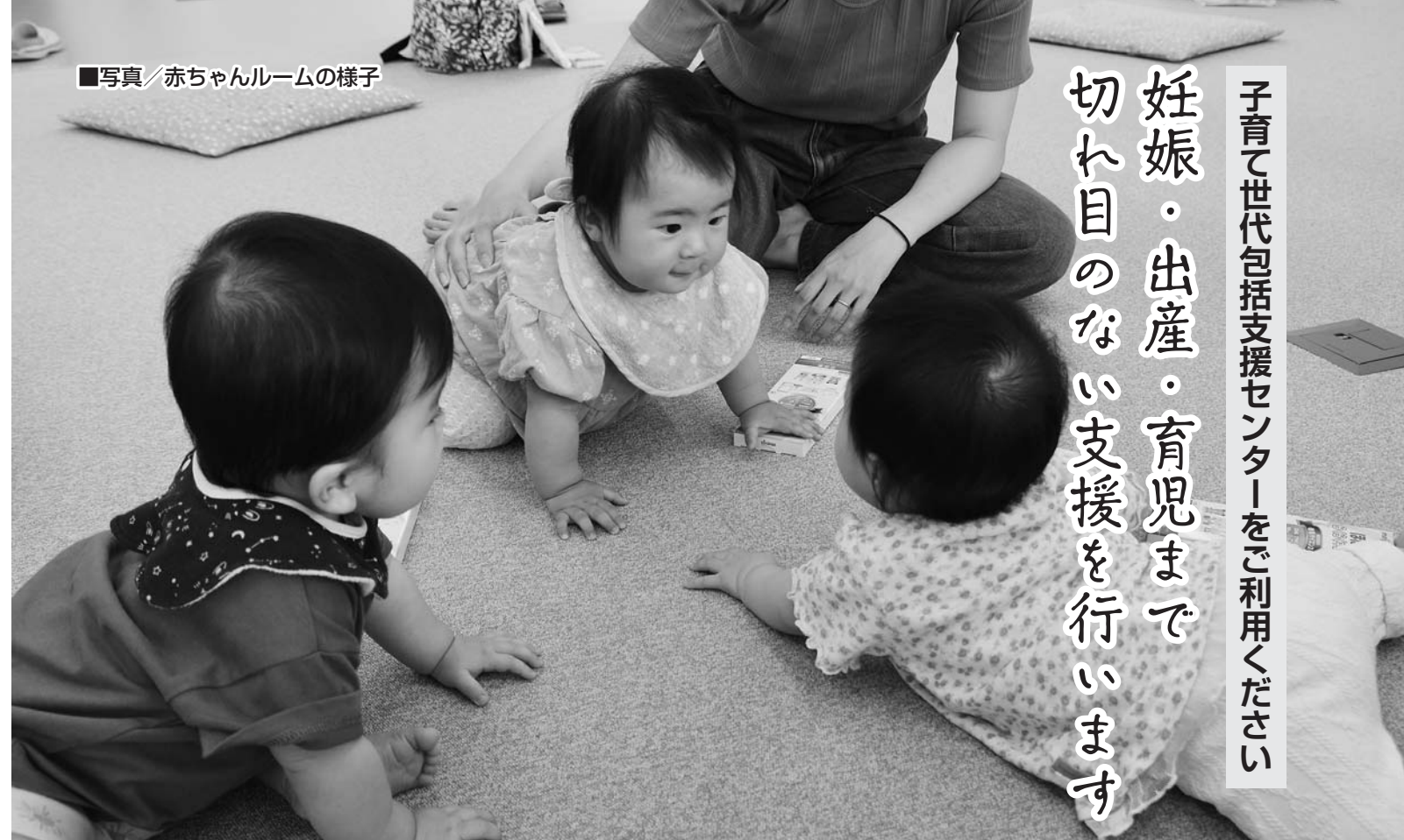
■写真/赤ちゃんルームの様子

子育て世代包括支援センターをご利用ください 妊娠・出産・育児まで 切れ目のない支援を行います