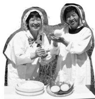
雪まらりのおにぎり美味しいよ!

(高橋) スタッフが年々高齢化してきていますので、次の世代から新たなスタッフを育成・確保しながら、活動を継続していきたいです。そのためにも、子どもたちが魅力を感じる行事を