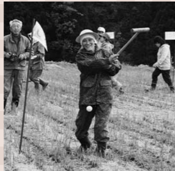
地区民のアイデアで生まれた「全日本中刈棚田のグラウンドゴルフ大会」。

平成28年に組織された「中刈村づくり実行委員会」の会長。集落内の棚田を中心とした村づくりをし、夏は棚田のライトアップ、秋は棚田でのグラウンドゴルフ大会や収穫祭、冬は道路の雪壁を利用したキャンドルロード(雪まつり)など、地区民手づくりのイベントを企画。