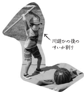
川遊びの後のすいか割り

来年、観光わらび園をオープンする予定です。こうした収益を地域に還元できるような地域づくりを考えています。細野では交流人口が増えています。ですが、住民から「泊まる場所がないね。」との声が出ています。また、今後かなりの世帯が高齢化し、運転できない人も出てくると思います。地元の人たちの集いの場とゲストハウスの機能も備えた、集落の中で仲良く助