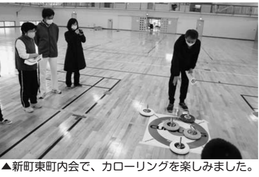
▲新町東町内会で、カローリングを楽しみました。

PM2.5微小粒子状物質等の測定結果 測定場所／村山市榎岡笛田局 12月18日まで測定した結果、注意喚起の暫定的な判断基準である時間平均80µg/mを超えた日はありません。 市環境整備課 生活環境係 【内線26】