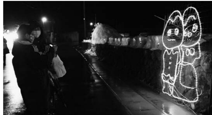
毎年2月に行っている「中刈キャンドルロード」(雪まつり)。中刈のキャラクター「おきな兄妹」がお出迎え。