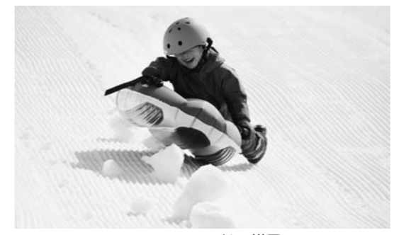
▲スノーランドの様子

徳良湖スノーランドオープン 期間／1月10日(日)～2月28日(日) 午前10時～午後3時 場所／ガラススタジオ旭前 内容／ソリ、スノーチューブ等の各種アクティビティ体験 (無料でお貸しします。スノーモビルのみ有料) ■入場料／無料 ※雪不足や荒天の場合は閉鎖します。市公式HPで確認してください。 市観光課 観光物産係 【内線25】