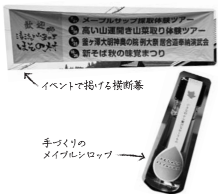
イベントで掲げる横断幕

皆さんの熱く、前向きな思いを聞いて、市長はどう感じましたか? (市長) 尾花沢市の魅力を、それぞれの地域の人がしっかりと考えていると心強く感じました。家族の中で会話が生まれる、今一番必要なのはそこなのではないかと思っています。一つのイベントを同じ目線で盛り上げられることも大事です。これをできないと言つのではなく、地域皆で意見を出し合い、どうやったらやれるのかを考える、これは市