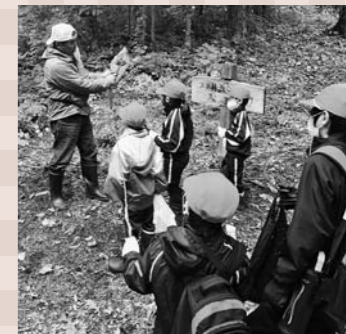
ニツ森ゆう大学スタッフも先生になった「ブナ林散策」。葉っぱでおぼけを作るぞ〜。

平成14年3月に発足した「ニツ森ゆう大学」を主宰。玉野地区の子どもたちを対象に、毎月1回のペースで子どもたちの地域行事を企画・開催（ニツ森登山、川遊び・バーベキュー、上の畑焼絵付け体験、そば打ち体験など）。