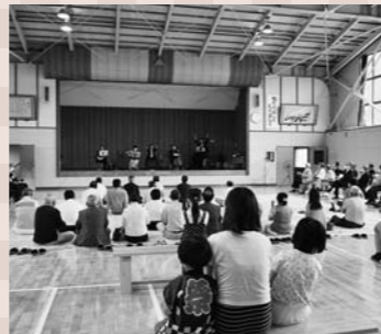
7月4日オープンした「名木沢生涯スポーツ交流センター」。福原地区民の新たな拠点として活躍。

平成30年8月に市長就任。現在就任3年目。市議会議員23年の経験を活かし、市民に寄り添いながら「人にやさしくあったかい元気な尾花沢」を目指し、市政運営に取り組んでいる。趣味はそば打ち。