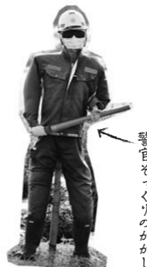
警官セックリのかかし

け合いながら暮らしていける新しいスタイルの共同住宅を建てるのもいいのではと考えています。