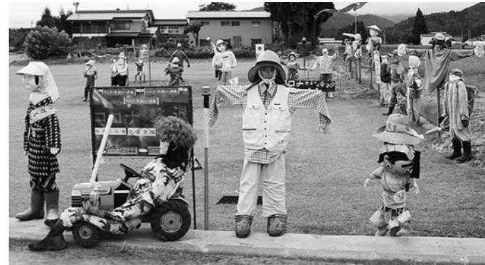
10月10日に開催した「ありがとう! かかし君感謝祭」。西原公民館隣のグラウンドゴルフ場に53体のかかしが集結!

来年、観光わらび園をオープンする予定です。こうした収益を地域に還元できるような地域づくりを考えています。細野では交流人口が増えています。ですが、住民から「泊まる場所がないね。」との声が出ています。また、今後かなりの世帯が高齢化し、運転できない人も出てくると思います。地元の人たちの集いの場とゲストハウスの機能も備えた、集落の中で仲良く助