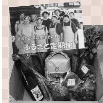
「ふるさと定期便」でオール細野産、の旬の味覚を全国にお届け!

での川遊びやブナ林散策など。今年は徳良湖で玉野小全校芋煮会も行いました。地域の行事なので、参加の意思は子どもたち、保護者の自由です。魅力がなければ参加してもらえないので、生徒の気持ちをいかに汲んでイベントを企画するか、そこが悩みです。 (五十嵐) 月1回定例会を開き、前月の振り返りと当月の事業計画を話し合っています。今年は新型コロナウイルスの影響で7月末まで活動停止し、8月から再開しました。8月10日に開催した御堂森登山には、市内外から山好きの方が参加してくれました。 地区民から、何のイベントをしているかわからないとの意見があったため、農家レストラン「蔵」の前に横断幕を作りました。イベントのある日は横断幕を掲げて、地区民にもわかるようにしています。 また、冬は老人世帯やひとり暮らし世帯、空き家などの除雪のお手伝いもしています。困ったのは、鳥獣被害です。今年はイノシシやサルの被害を