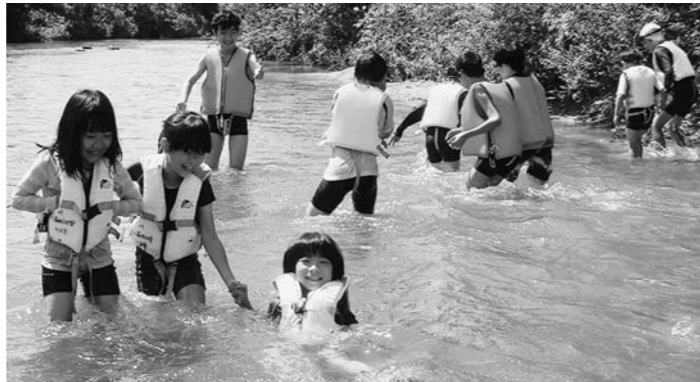
二ツ森ゆう大学夏のイベント「川遊び」。地元を流れる丹生川で大自然を体験!