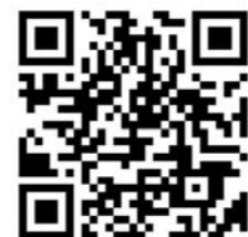
▲市ホームページに動画を掲載中です