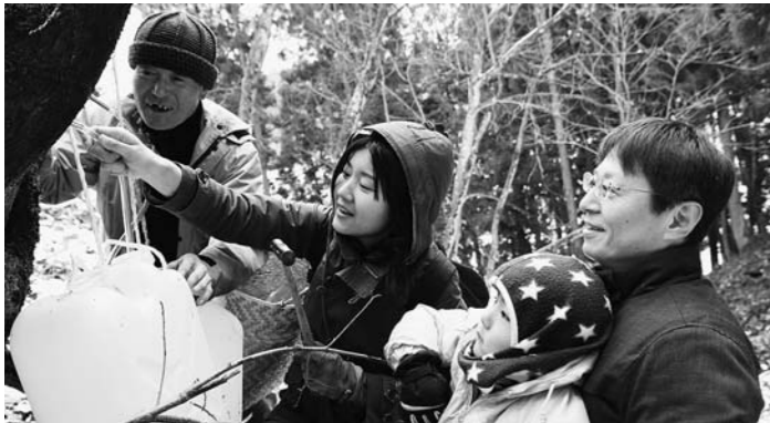
ほその村で2月に開催した「メープルサップ採取体験」。市外参加者との交流が定住にもつながっている。