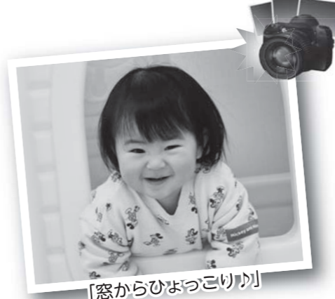
「窓からひよっこりか」