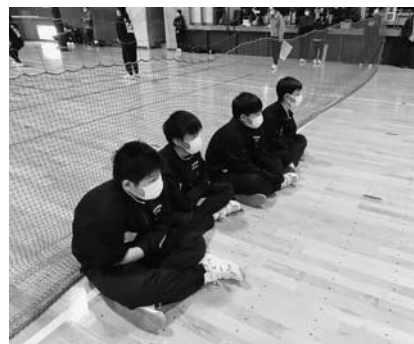
マスクをつけて静かに応援!