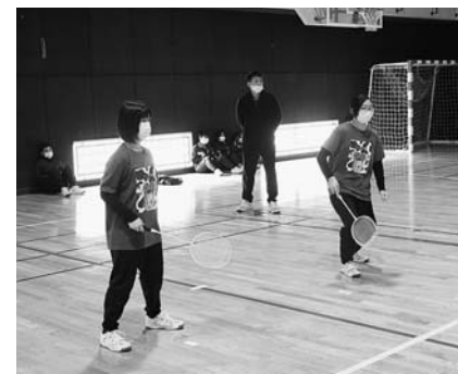
〈バドミントン〉 距離を保って連携プレー