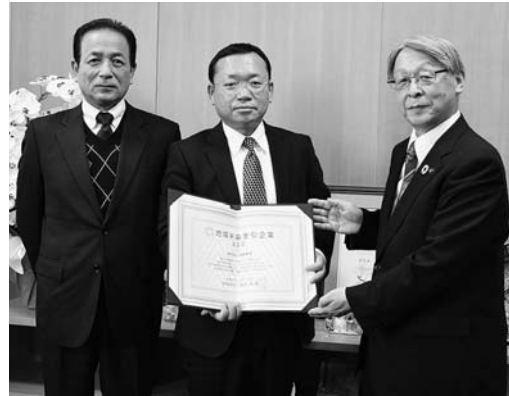
▲「今後も楽しみながら仕事ができる環境づくりをしていきたい」と意欲を見せる株式会社山陽精機山形工場の森製造本部長(写真中央)と、鎌田工場長(写真左)。

地域経済の中心的な担い手となる事業者を経済産業省が選定する「地域未来牽引企業」に、株式会社山陽精機が認定されました。本市では、オプテックス工業(株)、最上世紀に次いで3社目です。 株式会社山陽精機は、地元少年野球大会の開催や徳良湖周辺のゴミ拾いボランティアに長年参加するなど「地域と共に伸び行く企業」を目指しています。従業員の畑維持のために立ち上げた農業部門では16ha程の水田を耕作し、地元小学生の農作業体験や収穫祭も行っています。今後も行政や関係機関と連携しながら企業と地域とを繋ぎ、地域経済活性化のリーダーとして活躍されることを期待します。