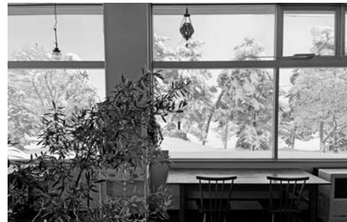
▲雪景色を眺めながら...

この冬は「これぞ尾花沢！」という本気が感じられる雪の量で、挨拶代わりに雪の様子をお話するのが日課になっています。雪が降るようになってからは、徳良湖のグースカフェにいらつしやるお客様は少なくなりましたが、久々の晴れ間が出るお客様の方が「今日は雪かきしなくて良いから」と立ち寄ってくれます。晴れた日の徳良湖は真っ白で本当に美しいのでぜひお立ち寄りください。 また2月28日まで徳良湖スノーランドがオープンしているの、雪遊び帰りにカフェで温まってゆっくり過ごすのもおすすめです。 去年から続く新型コロナの影響はなかなか落ち着きませんが、制限されている生活の中でのちょっとした楽しみや、気が休まる場所としてカフェが利用されている様子を見ると、「オープンできて良かったなあ」と感じます。 オープンから半年が経ち、少しずつ尾花沢に馴染みつつあるグースカフェ。これからも皆様のお越しをお待ちしています。