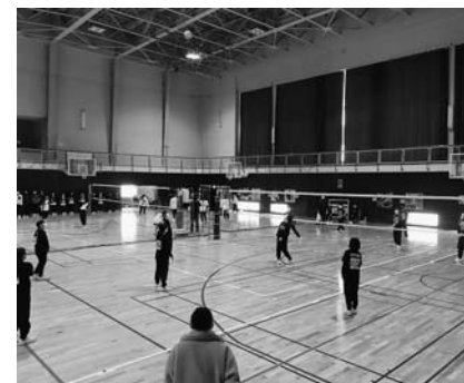
〈バレー〉チーム力が試される!

北村山高校では、12月21日・22日にクラスマッチを行いました。 クラスマッチは例年6月に行っていました。今年度は新型コロナウイルス感染症が拡大していた影響もあり、開催時期をずらし、感染予防の習慣が身についたこの時期に開催することになりました。そのため、例年屋外で行っているソフトボールや全校リレーなどの種目はできず、体育館で行うことのできる種目のみでの実施になりました。三密を防止するために対戦チームのクラスのみに入場を制限し、ソーシャル・ディスタンスを保つとともに、一人ひとりがマスクの着用を徹底し、また声を出しての応援を控えるなどの感染予防対策を、全校生徒で協力して行いました。 大きな声で自由に応援を送ることができないことなどは私たちにあって残念なことではありましたが、バレーやバドミントンなど様々な種目で白熱した試合が繰り広げられ、静かに、しかし熱く盛り上がりました。限られた環境の中で一人ひとりがしっかりと考えて行動したことで、楽しい時間を過ごすことができたことはもちろん、クラスの絆がより一層深まる良い機会にすることができました。 3年生にとっては、卒業式を残し、今回のクラスマッチが学校生活の中で最後の行事となっていました。後輩である2年生、1年生は、クラスマッチでも学校を大きく引っ張ってくれた3年生の先輩たちが、その熱量をそのままに、残りわずかとなりましたが、楽しく充実した学校生活を送ってほしいと願っています。