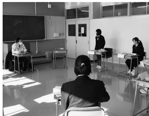
▲市内4事業所の経営者から話を聞き、意見交換を行った北村山高校2年生の生徒たち。地元企業を知る貴重な機会になりました。

企業懇談会では、北村山高校と連携して企業見学会や企業体験など、高校生の地元就職支援に取り組んでいます。 1月21日は、就職を希望する2年生約30人を対象に、オプテックス工業(株)、大地物流、(株)成和技術、(株)泉デザイン工房の代表らが講師となり「働くことの意味と心構え」をテーマに意見交換を行いました。 参加した生徒からは、「自分自身を知る大切さを学んだ」、「情報を自ら取りに行く大切さを知った」、「失敗を活かして成功するまでチャレンジしていきたい」、「地元企業を知る機会になった」などの感想が聞かれました。