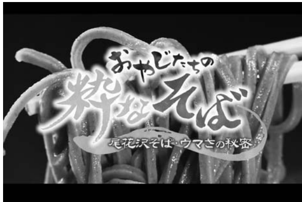
▲「おやじたちの絆なそば」と題し、山形県ゆかりの俳優がそば店や宝栄牧場をめぐり、尾花沢そばの美味しさの秘密にせまる番組構成となっています。

「連携中枢都市圏」は、中核市である山形市を中心に、近隣の市町村同士が連携して経済の活性化や都市機能の強化、生活サービスの向上を図ることを目的に形成する圏域です。 この度、新たに尾花沢市と大石田町が加わり、構成市町は村山地区7市7町(※)となり、圏域人口は約55万2千人(2015年時点)となりました。 今後、様々な連携事業を実施し、圏域の活性化を図るなど、各市町の強みを組み合わせ一丸となり、東北地方の中でも一番元気なエリアとして発展していくことを目指していきます。 (※)山形市・寒河江市・上市市・村山市・天童市・東根市・尾花沢市・山辺町・中山町・河北町・西川町・朝日町・大江町・大石田町