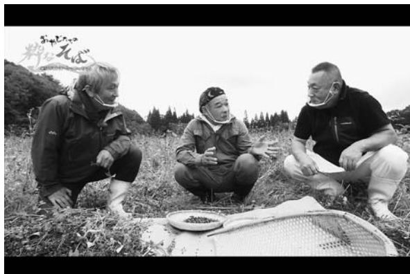
▲宝栄牧場での撮影の様子。そば店主とそば生産者が、「オール尾花沢産そば」ができるまでの熱い思いを語ります。

尾花沢市そば生産振興協議会は、そば生産者と販売店(そば店)、JA、行政からなる官民一体の組織で、原種最上早生の種子確保と尾花沢そばの生産、振興に取り組んでいます。 原種最上早生の種子は、他品種との交配を防ぎ、収穫量を増やすため、宝栄牧場内で高地隔離栽培を行っています。これにより原種最上早生を市内そば店で1年を通して提供できるようになりましたが、「尾花沢そば」の知名度向上が課題となっていました。 そこで、そば作付面積や収穫量で県内トップを誇るこだわりの「尾花沢そば」ブランドの確立を目指すため、プロモーション特別テレビ番組を制作しました。 種子生産から販売まで、「尾花沢そば」の全てを網羅したこの番組は、宮城県内で2月13日に放送されました。今後、「尾花沢市公式YouTube」へ掲載するほか、様々な場面で活用していきます。