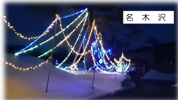
名 木 沢

西原地区ではかかし君が登場!寒い雪の中でもイルミネーションと共に色鮮やかにピカピカと冬の世界でもみなさんを見守り続けていました。(通常の期間より1週間長く見守っていました😊)