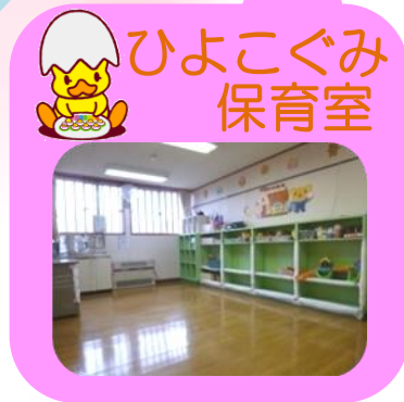
ひよこぐみ 保育室