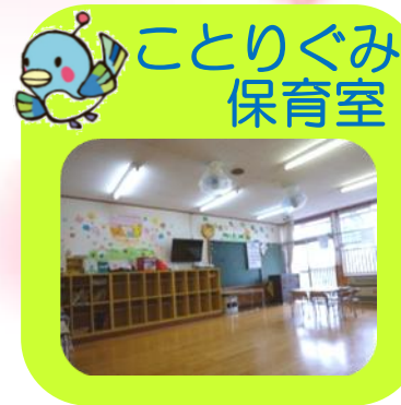
ことりぐみ 保育室