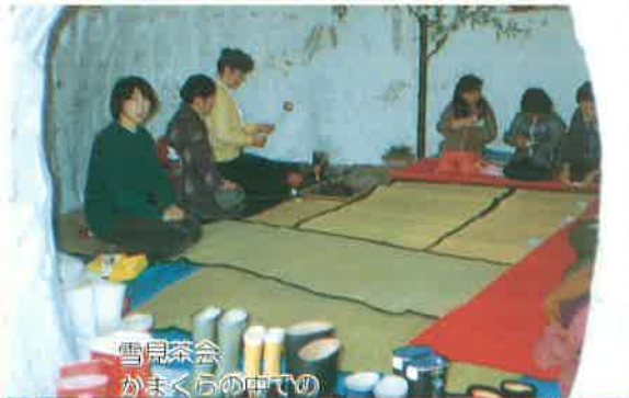
雪見茶会 がまくらの中での